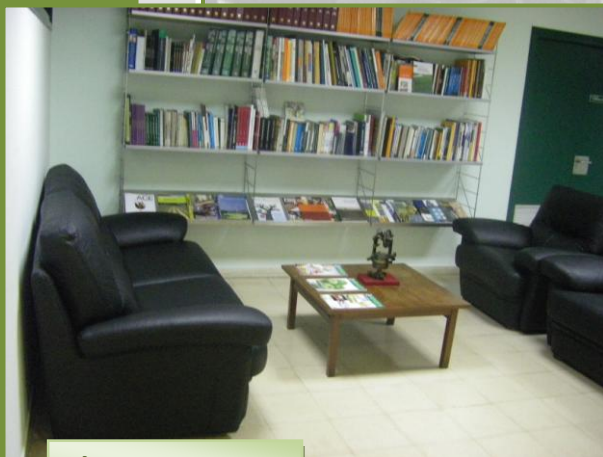
Àrea de descans