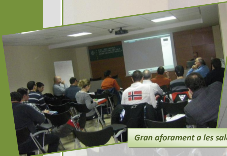
Gran aforament a les sales

Recordeu que els col·legiats teniu descomptes en el lloguer de sales.