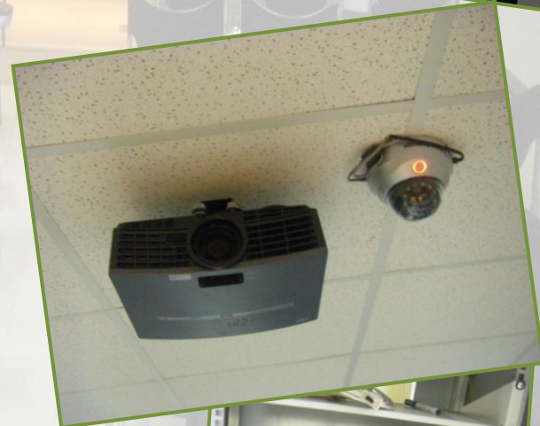
Sales totalment equipades